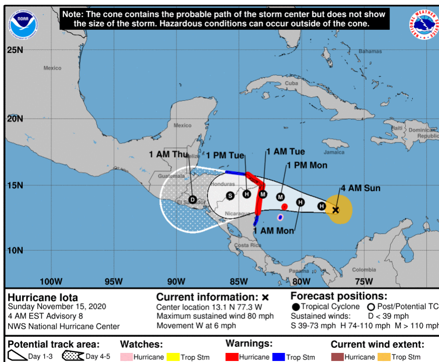
Gráfica 2. Cono de la posible trayectoria del Huracán IOTA para los siguientes días. NHC-National Hurricane Center 15 de noviembre de 2020. Hora 04:00 HLC.

De igual modo sugerimos especial cuidado en áreas de alta pendiente localizadas en las estribaciones de la Sierra Nevada de Santa Marta, La Guajira y Norte de Cesar y Magdalena. Igualmente, sectores de los departamentos de Bolívar; Atlántico, Córdoba, Sucre, Golfo de Urabá, de igual manera, los departamentos de Antioquia, eje cafetero, Chocó, Norte de Santander; Santander, Boyacá, Cundinamarca, Meta y Occidente de Arauca, Caquetá y Putumayo ante la probabilidad de crecientes súbitas y/o deslizamientos de tierra.